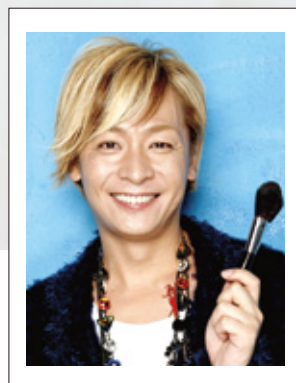
MAKE-UP ARTIST おぐねえー